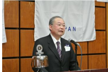
最近の感染症の話題と保健所