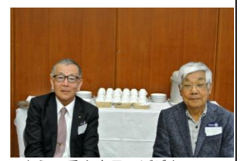
ようこそ！本日のビジター