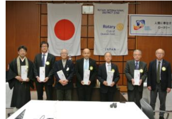
4月お誕生日おめでとう！