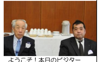
ようこそ！本日のビジター