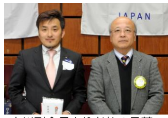
中川副会長よりお礼の言葉