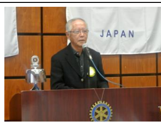
足立姉妹クラブ交流委員長