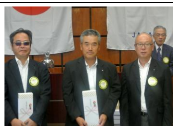
10月お誕生日おめでとう!