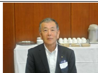
ようこそ!本日のビジター