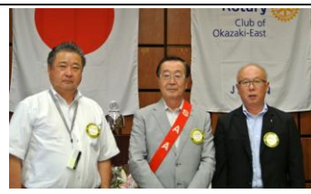
皆出席おめでとう!