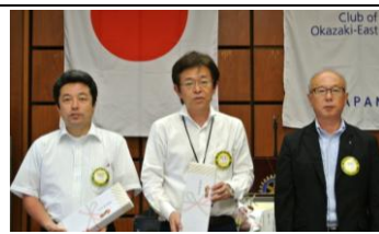
7月お誕生日おめでとう!