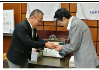
幹事バッジ引継ぎ