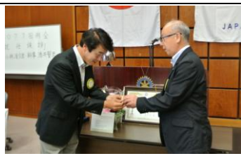
会長バッジ引継ぎ