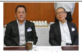
ようこそ! 本日ビジター