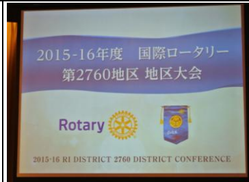
地区大会リハーサル