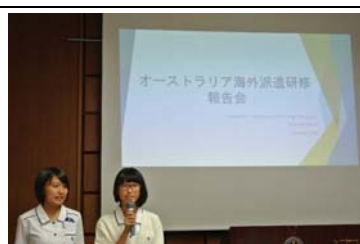
世界へのプレゼンターになりました