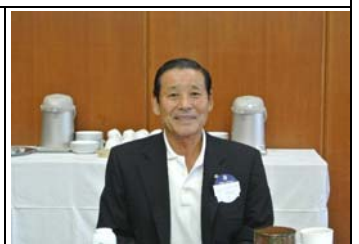
ようこそ！本日のビジター様