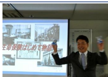
卓話：生命保険はじめて物語