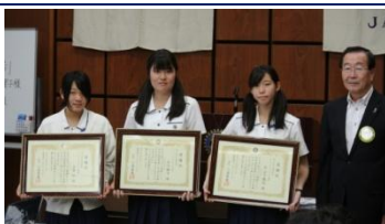
光ヶ丘高校 IAC へ助成金と感謝状