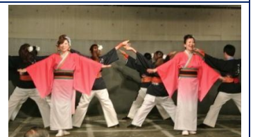
きらら岡崎の演舞