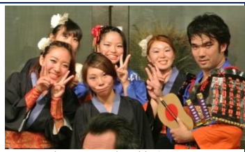
きらら岡崎の皆さん