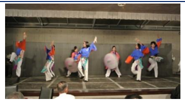
きらら岡崎の演舞