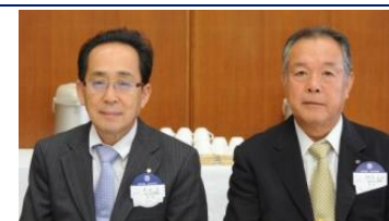
地区大会実行委員会の皆様