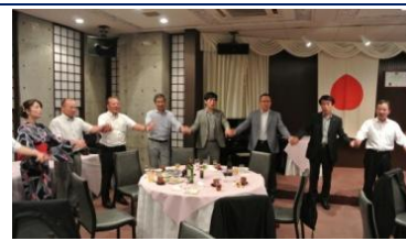
ロータリーソング「手に手つないで」