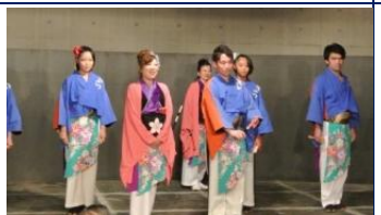
きらら岡崎の演舞