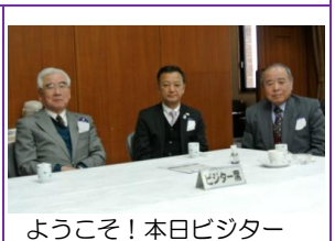
ようこそ！本日ビジター