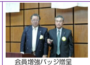
会員増強バッジ贈呈