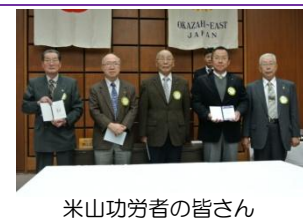
米山功労者の皆さん