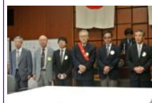
10月お誕生日の皆さん