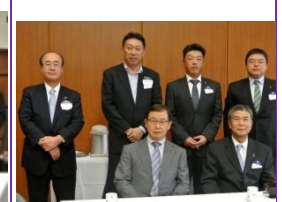
本日ピジターの皆様