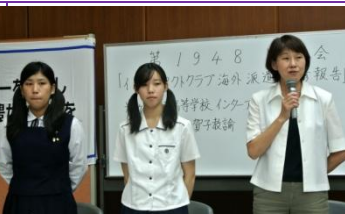
卓話：インターアクト海外研修報告