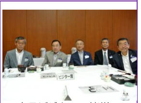
本日ビジターの皆様