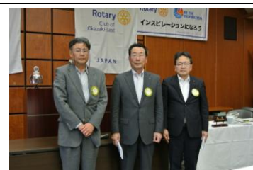
宇野副会長よりお礼のご挨拶