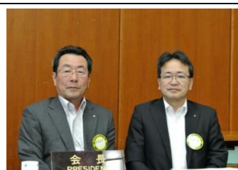
本日の卓話：「一年を顧みて」