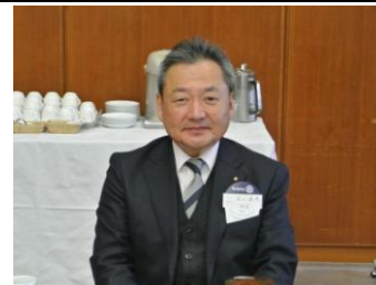
ようこそ！本日のビジター