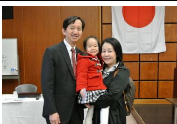
元米山奨学生コンティリ様とご家族