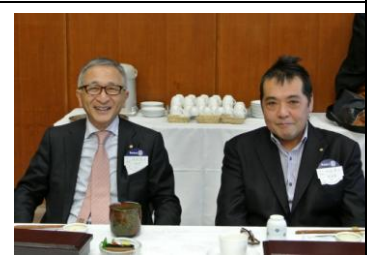
ようこそ! 本日のビジター