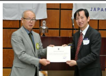
カンボジア小学校助成金授与